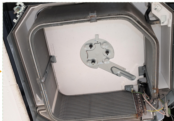
分解洗浄で新品同様に